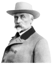
VIGGO HØRUP (1847-1902) STIFTER AF POLITIKEN I 1884

8 læserbreve og debatindlæg handlede om omskæring