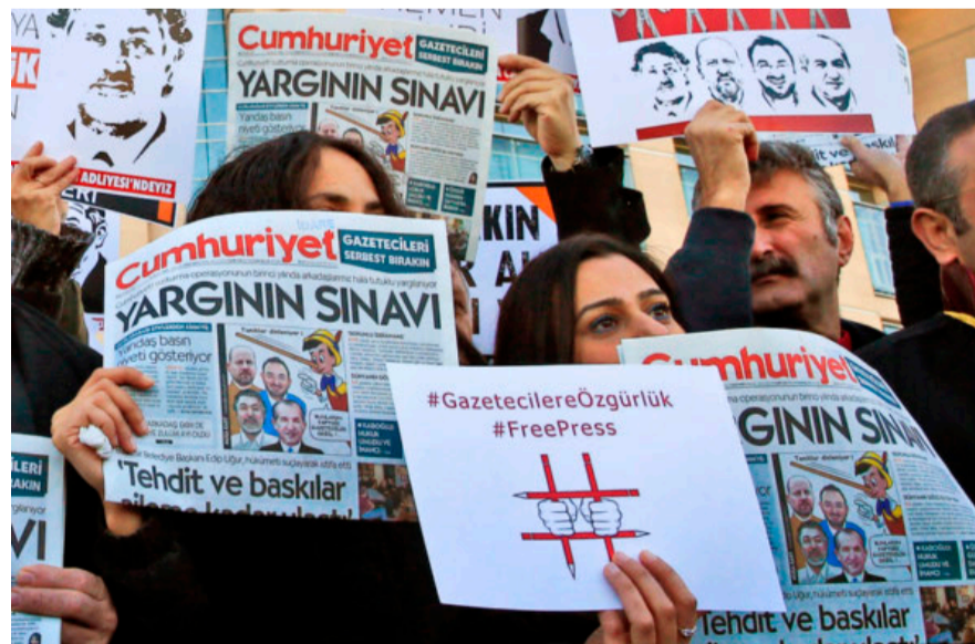
MEDIEFRIHED. Pressens frihed er truet mange steder. Ikke mindst i Tyrkiet, der har europarekord i fængsling af journalister.

Med rødmer i enevælden sker det ikke på grund af sløvsind eller dumhed, men fordi de føler det som en 'magtens ret' at regere landet med offentligheden på en