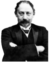
EDVARD BRANDES (1847-1931) STIFTER AF POLITIKEN I 1884